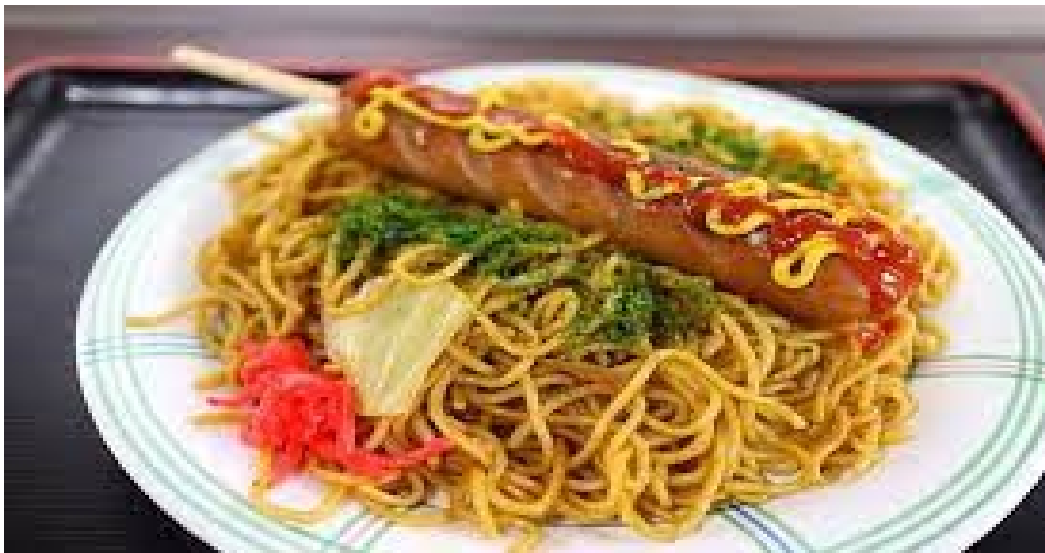
やきそばフランク ¥ 500