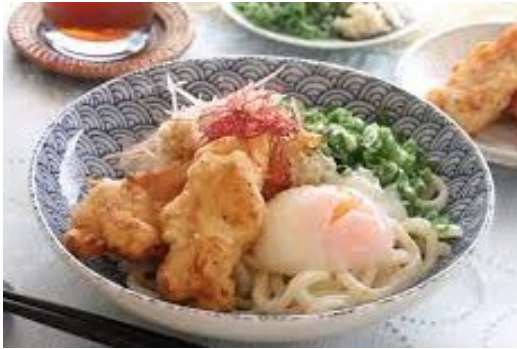
鶏天冷しうどん ¥ 500