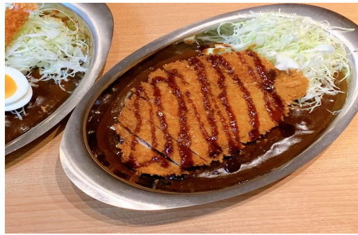
かつカレー ¥ 500