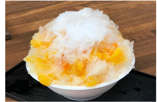
みかんかき氷 (練乳かけ) ¥ 500